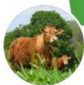
Ferme expérimentale de Thorigné d'Anjou